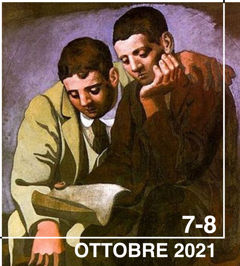
Pablo Picasso, La lecture de la lettre , 1921