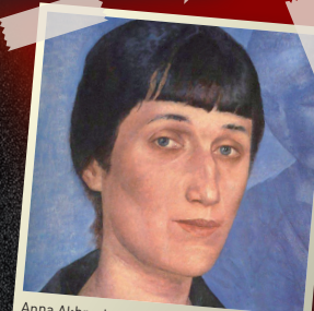
Anna Akhmatova 1889-1966