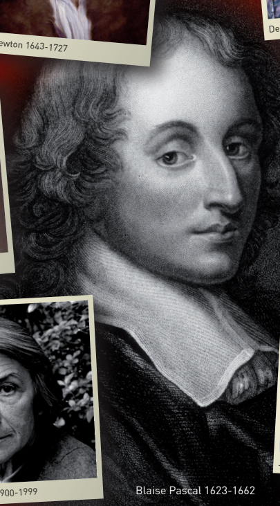
Blaise Pascal 1623-1662

FACULTÉ DES LETTRES ET SCIENCES HUMAINES