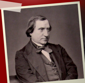
Ernest Renan 1823-1892