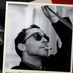
Jean-Luc Godard 1930