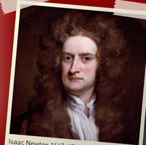
Isaac Newton 1643-1727