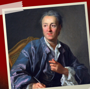
Denis Diderot 1713-1784